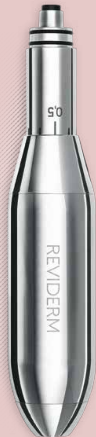
REIFE HAUT – BEHANDLUNGSVERLAUF / WIRKWEISE